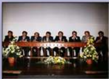
Representantes de los Partidos Políticos presentan sus propuestas en el Congreso Boliviano de Salud