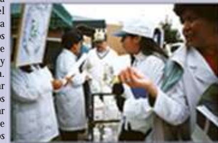
Participantes de El Alto en la Feria de Medicamentos

exposiciones de materiales y demostraciones y la difusión de mensajes impresos y audiovisuales.