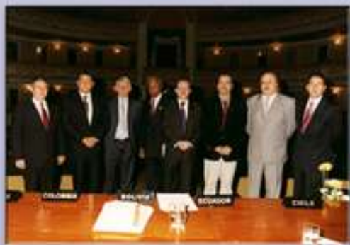
Los Ministros Andinos de Salud participantes en el Congreso de Salud de Sucre

Todo este análisis y las recomendaciones están en la "Declaración del Foro de Ministro Andinos" sobre la reforma del sector salud; suscrito el 24 de abril del año 2002.