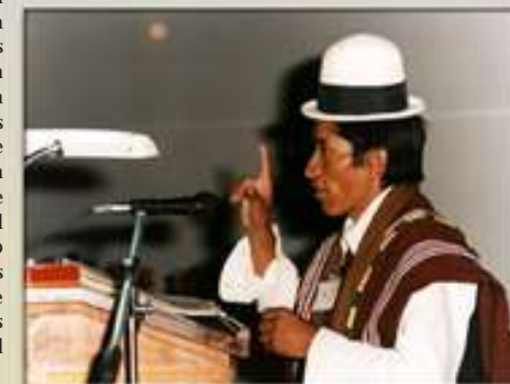
Un representante de las Comunidades indígenas de Potosí presenta su ponencia en el Congreso Boliviano de Salud

Finalmente instaron a los partidos políticos, a los administradores y técnicos de salud a trabajar con sensibilidad social, compromiso, solidaridad y equidad, a fin de superar las barreras económicas, socioculturales y de género y de consolidar un Estado capaz de ofrecer servicios de salud con calidad y calidez, para potenciar su capital humano, acelerar la lucha contra la pobreza y consolidar el proceso de desarrollo del país. Así como la salud es un derecho, concluyeron los representantes de la sociedad civil, también es el factor fundamental del desarrollo.