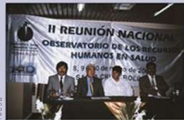
El Ministro de Salud inaugura la Reunión Nacional del observatorio de Recursos Humanos

El Observatorio de Recursos Humanos de Salud es una institución que se origina en una iniciativa regional orientada a mejorar la calidad y oportunidad de las decisiones sectoriales, en materia de políticas de RR.HH. y de gestión de personal de salud. Apoya el fortalecimiento de políticas de desarrollo de RR.HH. en los procesos de cambio de los sistemas de salud del país.