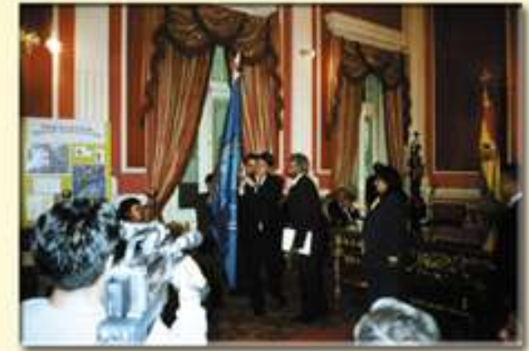
El Ministro de Salud impone el Escudo de Armas de la Ciudad de La Paz al estandarte de OPS, en su centenario