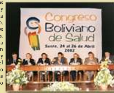
Ex ministros de salud presentan las conclusiones y recomendaciones del Congreso Boliviano de Salud

que será próximamente publicado, con el apoyo de OPS/OMS, bajo el título de "El libro blanco de la salud boliviana" que será representado al próximo gobierno.