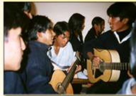
Jóvenes de El Alto, en la inauguración de los centros de adolescentes en Villa Centenario

El 12 de abril pasado, en conmemoración del día de los Derechos del Niño Boliviano se inauguraron dos de los cuatro Centros Comunitarios de Adolescentes que se están implementando en el Distrito "Centenario" de la ciudad de El Alto de La Paz. Se trata de los Centros Capilupaca y Pacajes Caluyo. El acto inaugural contó con la participación de estudiantes de la Unidad educativa Francia, grupos de jóvenes, dirigentes vecinales, junta escolar, autoridades municipales y personal de CISTAC, OPS/OMS, del Ministerio de Salud, UNFPA y otras organizaciones locales.