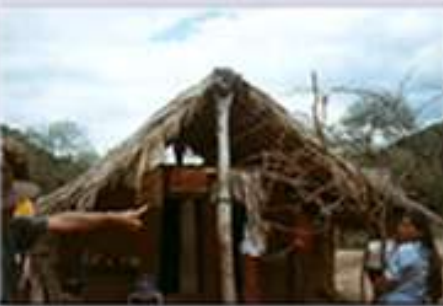
Vivienda de una familia del Chaco boliviano

La reactivación del Proyecto consiste en la planificación de nuevas intervenciones en dicha región y la inclusión de Bolivia en la segunda etapa del Proyecto de Comunidades Indígenas, que se desarrollará en el presente año, con financiamiento adicional de la GTZ.